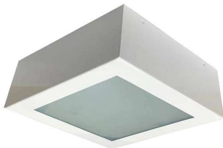
Figura 01 – Luminária Tipo Plafon Quadrado com Duas Lâmpadas de LED 10W.