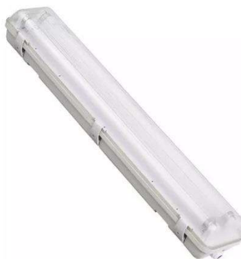
Figura 04 – Luminária Hermética Tubular com Duas Lâmpadas de LED 1,2m de 18W.