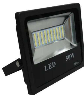
Figura 03 – Refletor de LED 50W